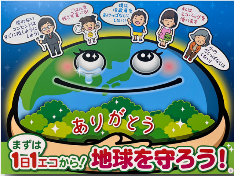
第5位 サインクリエイター協会賞 秋田県 (有)ビッグアート 煤賀 繁広氏