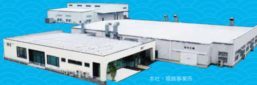
本社・福島事業所