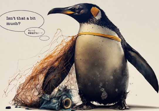
なくそう! 海洋ゴミ