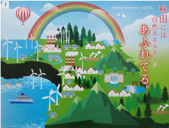
優秀賞 秋田県 東京電装工業(株)