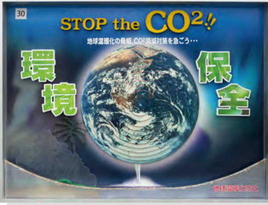
優秀賞 青森県 (株)ニッタ美術工芸