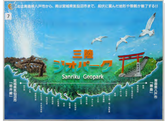
優秀賞 岩手県 (有)第二美工

中心の木を取り巻くイラストも簡潔で、グリーン系の色でまとめやわらかで落ち着きがある。(花巻) タイトルの内容にふさわしい穏やかな緑系の色彩でまとめ、英文字や図柄の線もきつい強さを抑えたこげ茶色で描いている。図柄の形が明快で、図柄から意味が理解できる堅実な表現に惹かれた。(曾根原)