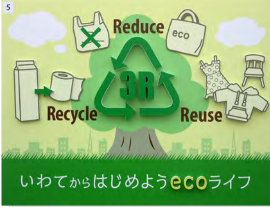
優秀賞 岩手県 (株)栄建

中心の木を取り巻くイラストも簡潔で、グリーン系の色でまとめやわらかで落ち着きがある。(花巻) タイトルの内容にふさわしい穏やかな緑系の色彩でまとめ、英文字や図柄の線もきつい強さを抑えたこげ茶色で描いている。図柄の形が明快で、図柄から意味が理解できる堅実な表現に惹かれた。(曾根原)