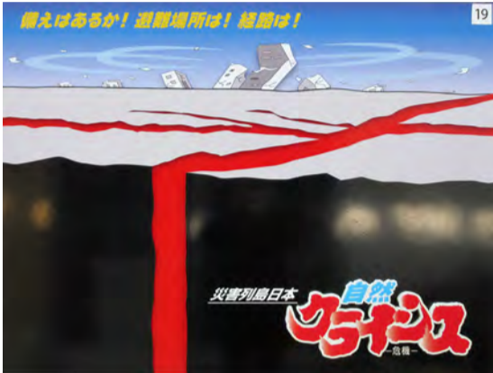
東北地区連会長賞 山形県 (有)大井看板