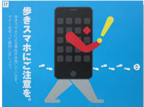
国土交通大臣賞 山形県 (有)京野工芸

図柄の取り合わせがすばらしい。文字の大きさスタイルもよい。(花巻) 端的に整理された図柄(地割れした大地・人造物・空気)と調和のとれた文字で効果的に構成された象徴的な表現。静けさの中に「こと」の重大さが響く。発想と表現に惹かれた。(曾根原)