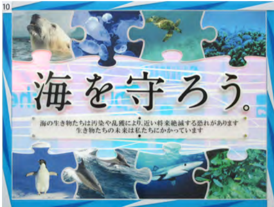
(社)日広連会長賞 宮城県 (有)ササキ創芸