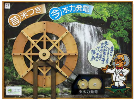
優秀賞 福島県 (有)タカ工芸社

色の配合がきれいで気持ちよい。多い形も組み合わせがスッキリしていてすばらしい。(花巻)